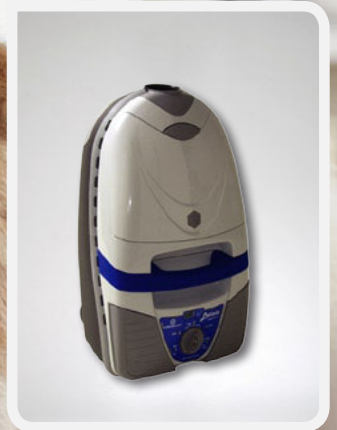
LETIZIA HEPA Klasse A+