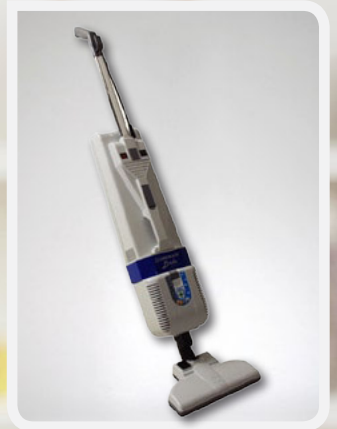
LINDA HEPA Klasse A