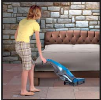
LA PIÙ BASSA AL MONDO

Soltanto 14 cm è l'altezza della base e permette di accedere facilmente sotto i mobili bassi. La notevole inclinazione del corpo aspirante verticale consente il lavaggio sotto i tavoli.