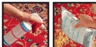
LAVAGGIO A SECCO