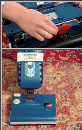
SISTEMA DI LAVAGGIO A SECCO D.C.S.

Test con filtri di serie e filtro Hepa in uscita