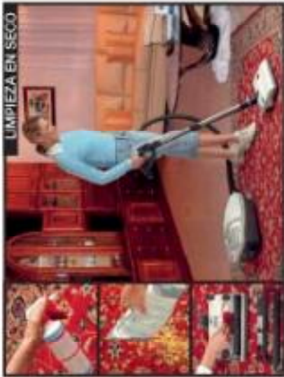
LIMPIEZA EN SECO

El juego de engranajes en la rueda de la boquilla y las tres ruedas orientables giratorias, permiten tener la máquina con el mínimo esfuerzo también al abordar de los obstáculos. El patinete suave a 360° protege la máquina contra rasguños y choques.