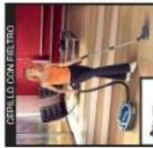
CEPILLO CON FILTRO

Este cepillo potente en la rueda de engranajes multifuncional puede aspirar sobre alfombras, moquetas y alfombras. Este cepillo potente en la rueda de engranajes multifuncional puede aspirar sobre alfombras, moquetas y alfombras.