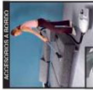
ACCESORIOS A ROLLO

El cepillo con filtro de la rueda de engranajes multifuncional puede aspirar sobre alfombras, moquetas y alfombras. Este cepillo potente en la rueda de engranajes multifuncional puede aspirar sobre alfombras, moquetas y alfombras.